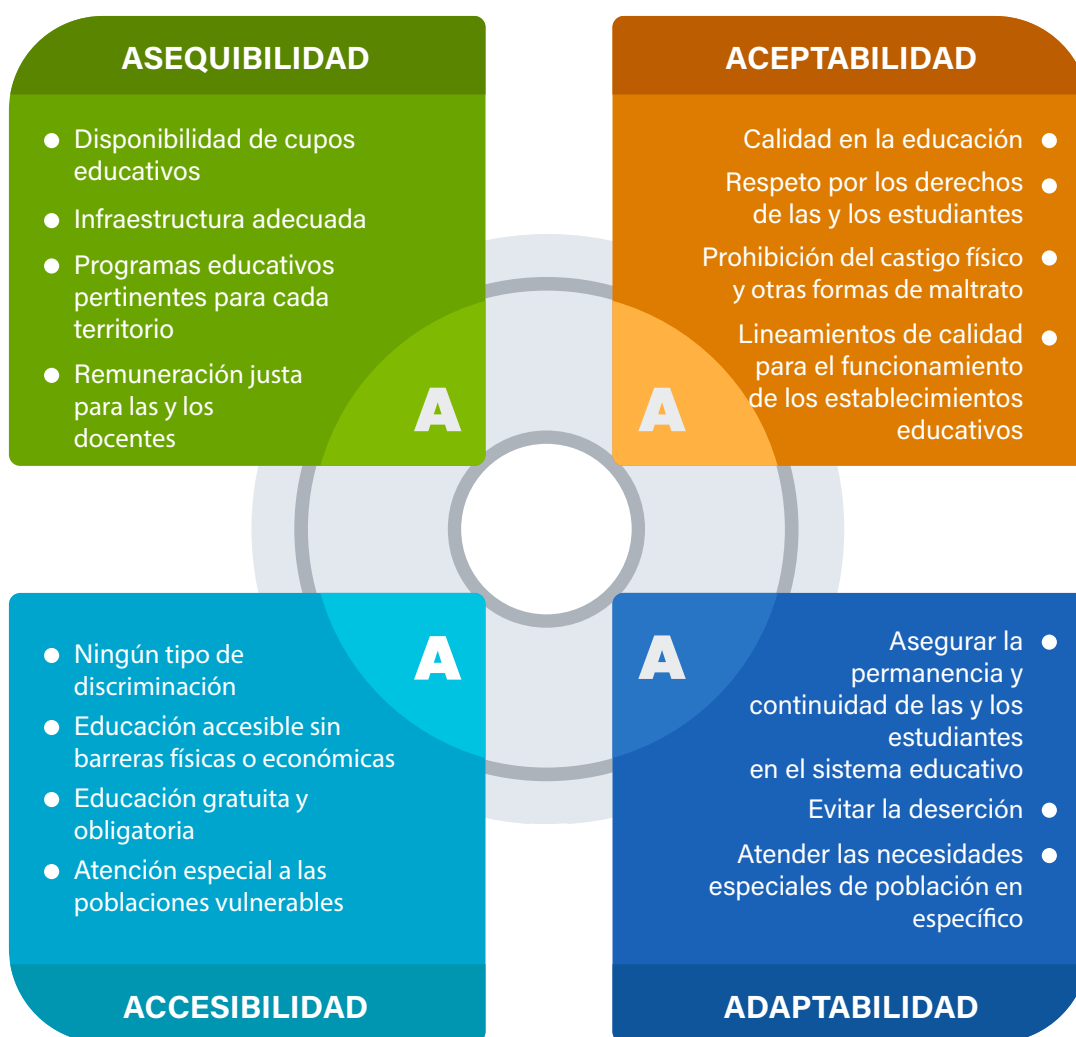
Gráfico 3. Esquema de las 4 A. Elaboración propia