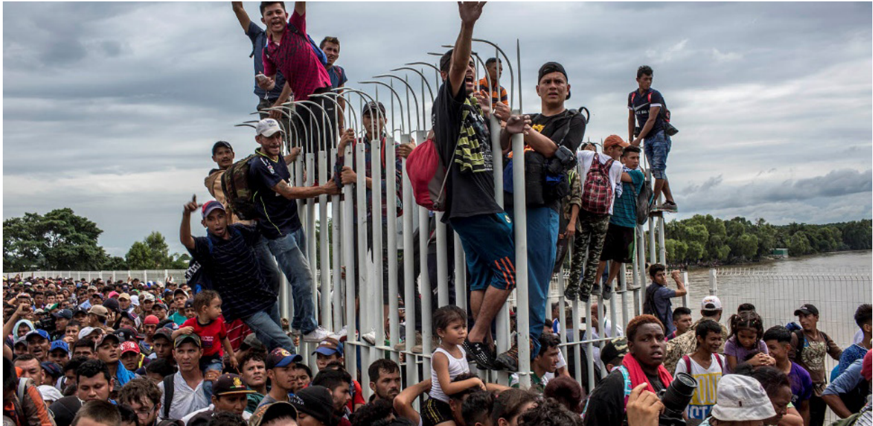
Migrantes se aglomeran alrededor y encima de las rejas abiertas para acceder a suelo mexicano

Gases lacrimógenos contra migrantes. Hombres y mujeres con sus hijos a hombros que claman, desesperados, que les abran la frontera. Jóvenes que, de puro hastío, se lanzan al Suchiate para cruzar irregularmente al otro lado. El puente entre Tecún Umán y Ciudad Hidalgo es un campo de refugiados en movimiento.