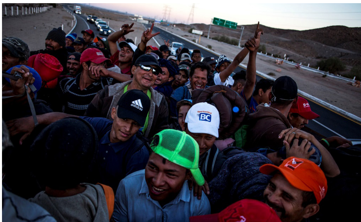
Migrantes cruzan el desierto entre Mexicali y Tijuana en el remolque de un camión, el martes 20 de noviembre