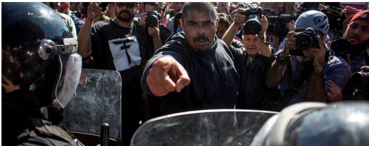
Un agitador, incorporado en la marcha anti migrantes, insulta a los policías municipales dispuestos en cordón para proteger el acceso al albergue de los migrantes

Fake news y racismo institucional son la gasolina que incendia la xenofobia. El domingo 18 de noviembre, un pequeño grupo de tijuanaenses y norteamericanos marcharon coreando consignas contra los migrantes centroamericanos. Anunciaron más acciones, pero tienen poco margen de actuación. Habrá que ver si el fenómeno crece en caso de que la situación en Tijuana se pudra.