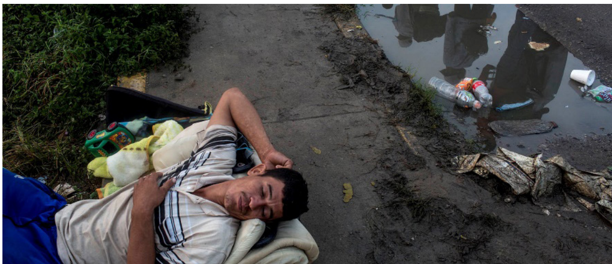
Un migrante descansa a la orilla de la carretera, en Matías Romero, antes de salir rumbo al estado de Veracruz

La caravana se parte al llegar al estado de Veracruz. La víspera, antes de que una tormenta obligase a desalojar el campo de fútbol convertido en albergue, se acordó pernoctar en Donají, en Oaxaca. Pero la avanzadilla no quedó conforme y siguió casi 100 kilómetros más. El éxodo avanza porque no tiene otra alternativa. Un equipo de negociación está dispuesto para hablar con el Gobierno. Quieren que las reuniones sean en Ciudad de México.