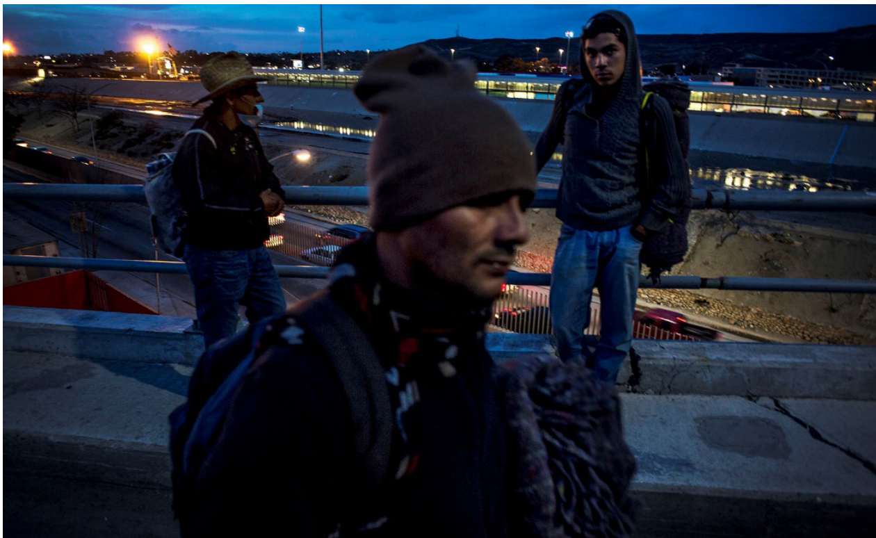
Los primeros hondureños de la segunda caravana alcanzan el puente fronterizo de Tijuana, en la noche del jueves 22 noviembre