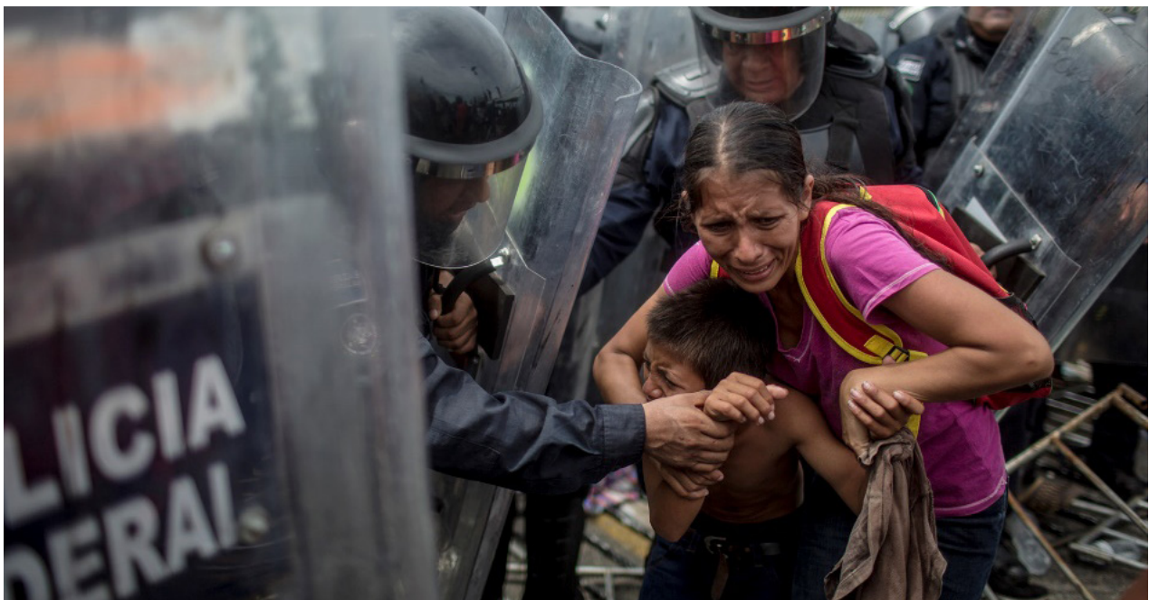
Madre e hijo huyen aterrorizados después del uso de gases lacrimógenos por parte de la policía federal

A pesar de que la represión policial fue bastante contenida, no faltaron momentos de mucha tensión y pánico, debido al lanzamiento de gases lacrimógenos.