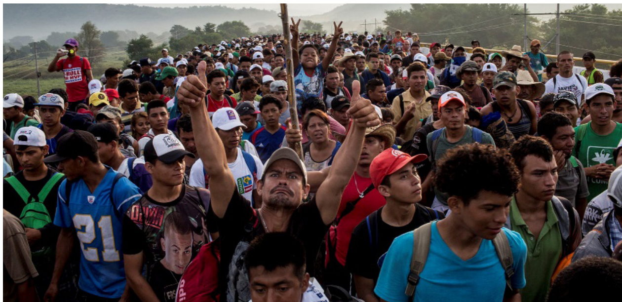
Miles de migrantes cruzan el puente fronterizo entre el estado de Chiapas y Oaxaca, después de que la Policía Federal los detuvo por dos horas

Como en otras varias ocasiones, el susto y la preocupación por la posible represión policial dejan espacio a la euforia, pasado el peligro, a la hora de cruzar el puente fronterizo entre Chiapas y Oaxaca.