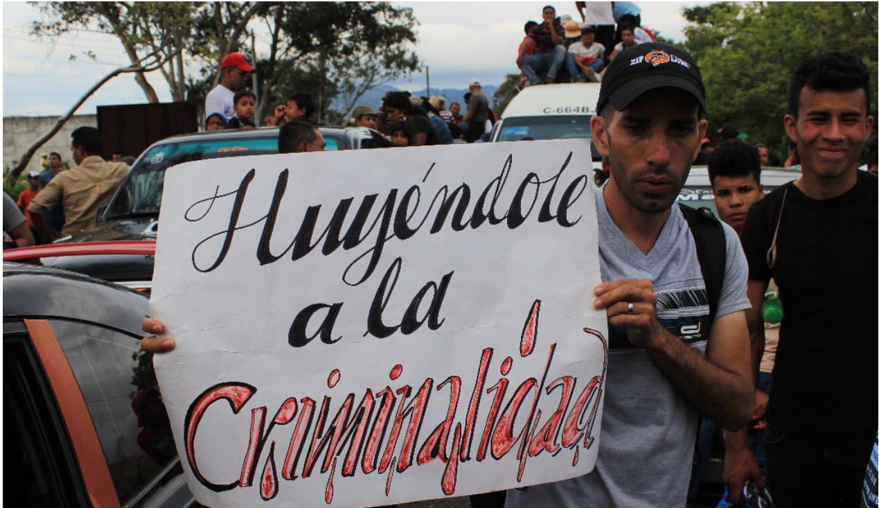
Mientras la Policía Nacional Civil de Guatemala evita que la Caravana Migrante ingrese al país, un hombre hondureño muestra un cartel, pidiendo que se le permita continuar su camino.