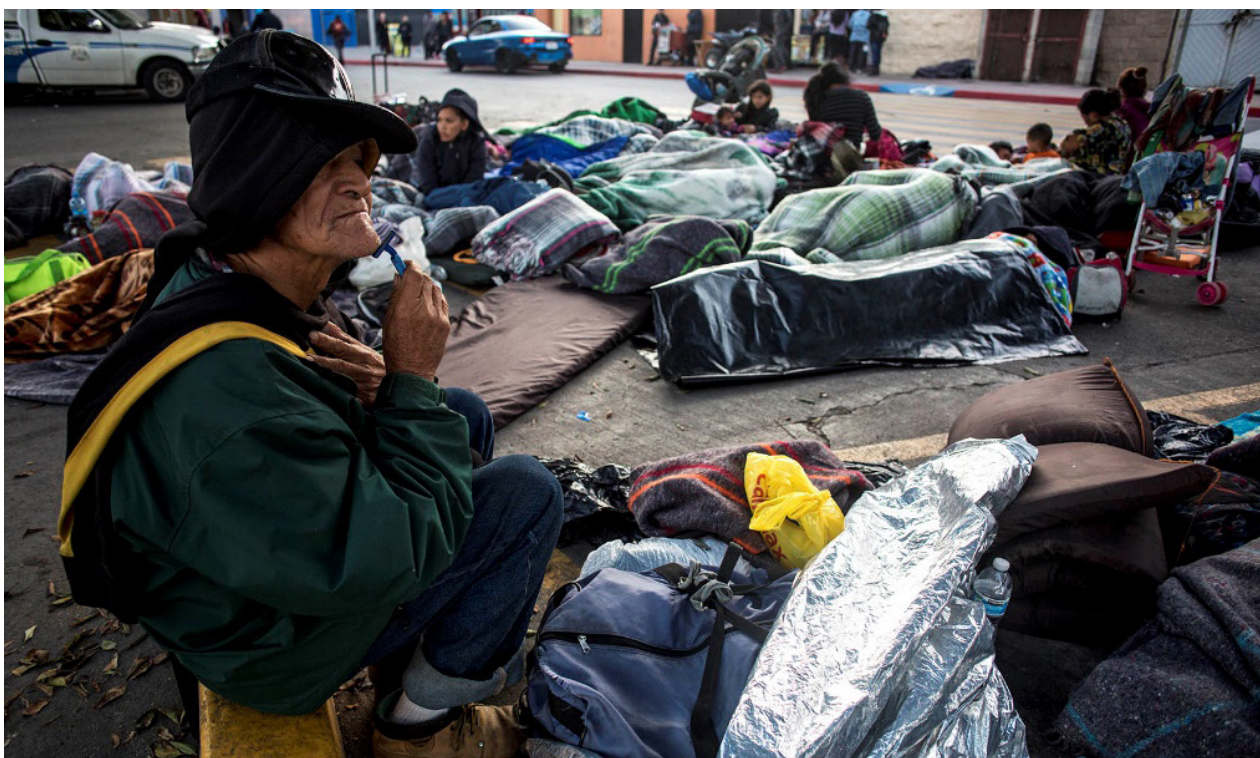
Un anciano se rasura en la madrugada del viernes 23 de noviembre. Como medida de presión simbólica hacia las autoridades fronterizas, unos cientos de migrantes pasaron la noche del viernes 23 bajo el puente fronterizo