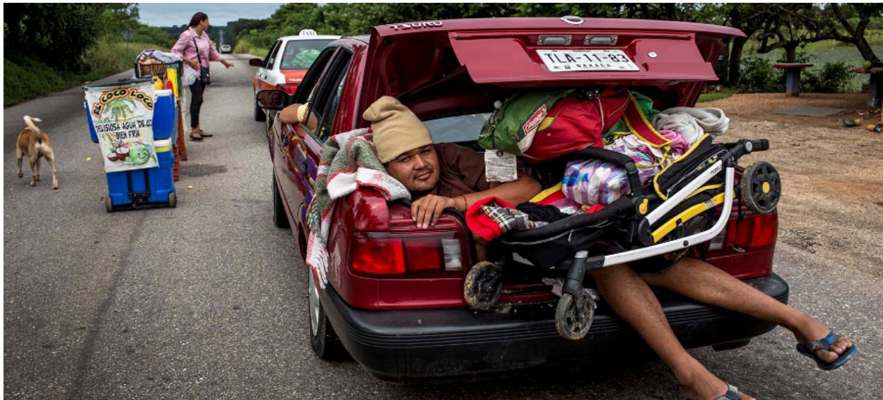
Un migrante viaja en el baúl de un carro, en el recorrido desde Sayula hasta Isla, estado de Veracruz

Momento crítico para la caravana migrante. El gobernador de Veracruz, Miguel Ángel Yunes, ofreció la noche del viernes transporte para todos hasta la Ciudad de México. Su propuesta aguantó dos horas. Nadie sabe por qué se echó atrás. Los caminantes, decepcionados y hartos, se rompen. Una parte queda en Isla, estado de Veracruz. La avanzadilla llega hasta la capital. En Puebla, decenas de personas llegan completamente destruidas tras horas subidos en camiones.