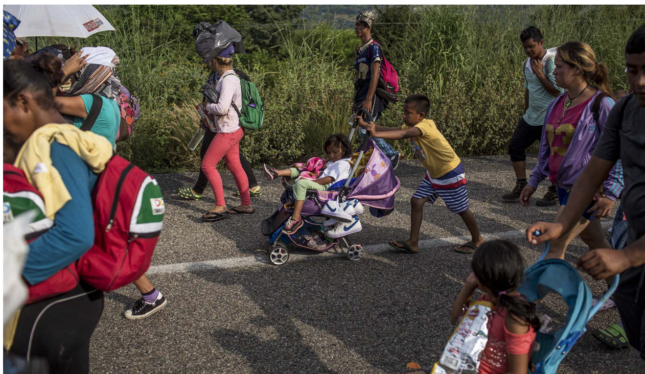
Un niño empuja el carruaje donde viaja su hermana, entre los demás caminantes.