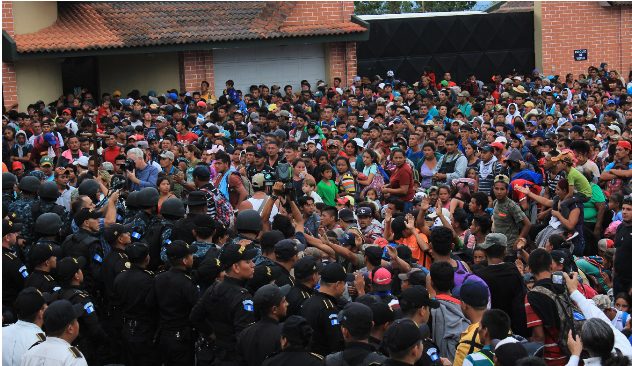
De un lado la Caravana Migrante compuesta de hombres, mujeres, ancianos y niños; del otro, un grupo de policías que les impide el paso.