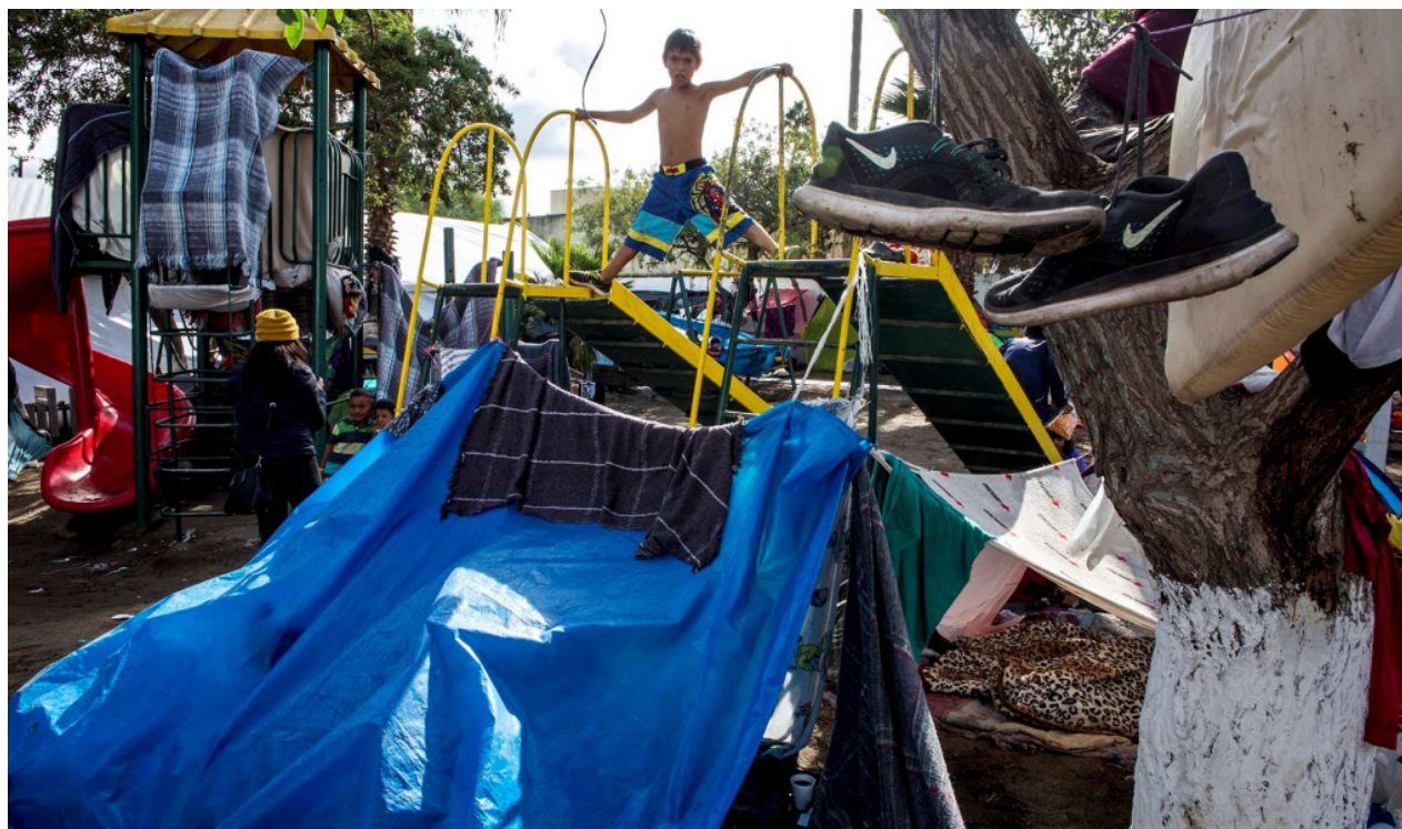
Un niño se resiste jugando entre dos resbaladeros en los que antes era el parque de juegos del albergue y que, el jueves 22, ya estaba saturado de carpas