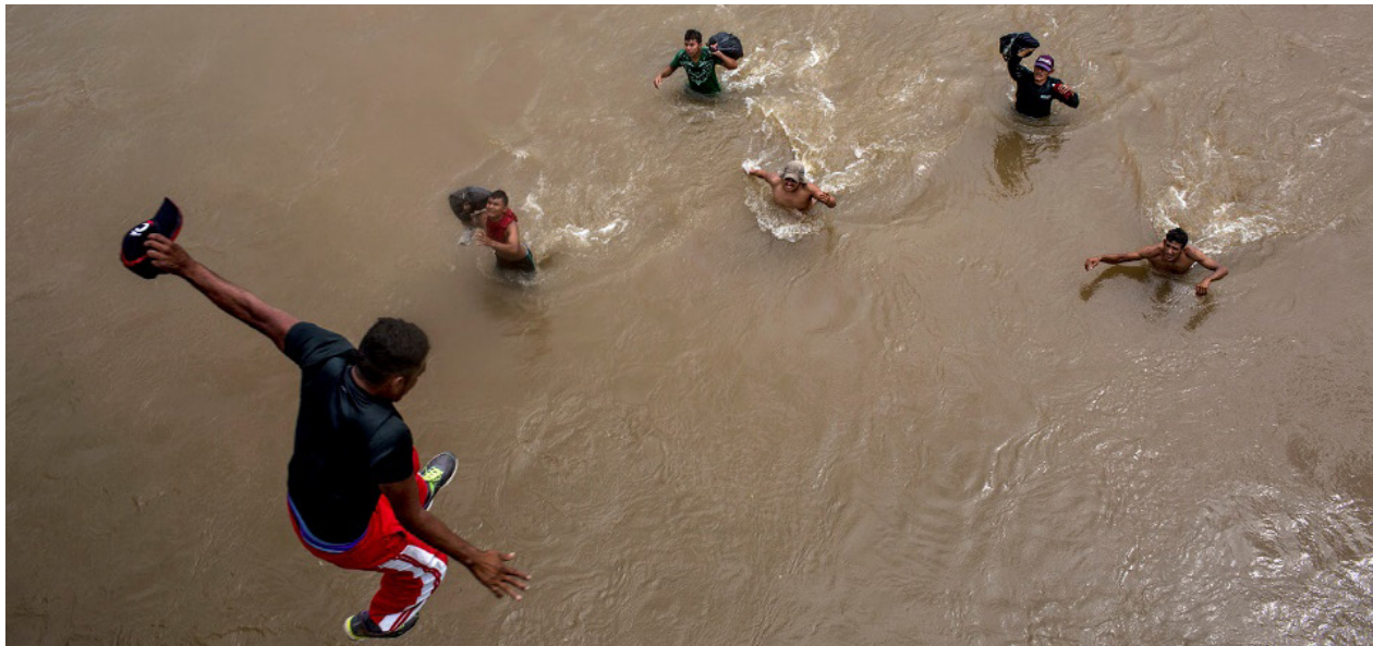
Un migrante se lanza al río Suchiate para alcanzar territorio mexicano nadando

Imposibilitados en cruzar la frontera por vía legal, los más intrépidos empezaron a lanzarse al agua del río Suchiate, alcanzando suelo mexicano de “mojados”. La mayor parte de los migrantes logrará alcanzar Ciudad Hidalgo con un poco más de paciencia y sin tener que nadar, aprovechando el sistema de balsas bajo el puente, a lo largo de los días siguientes.