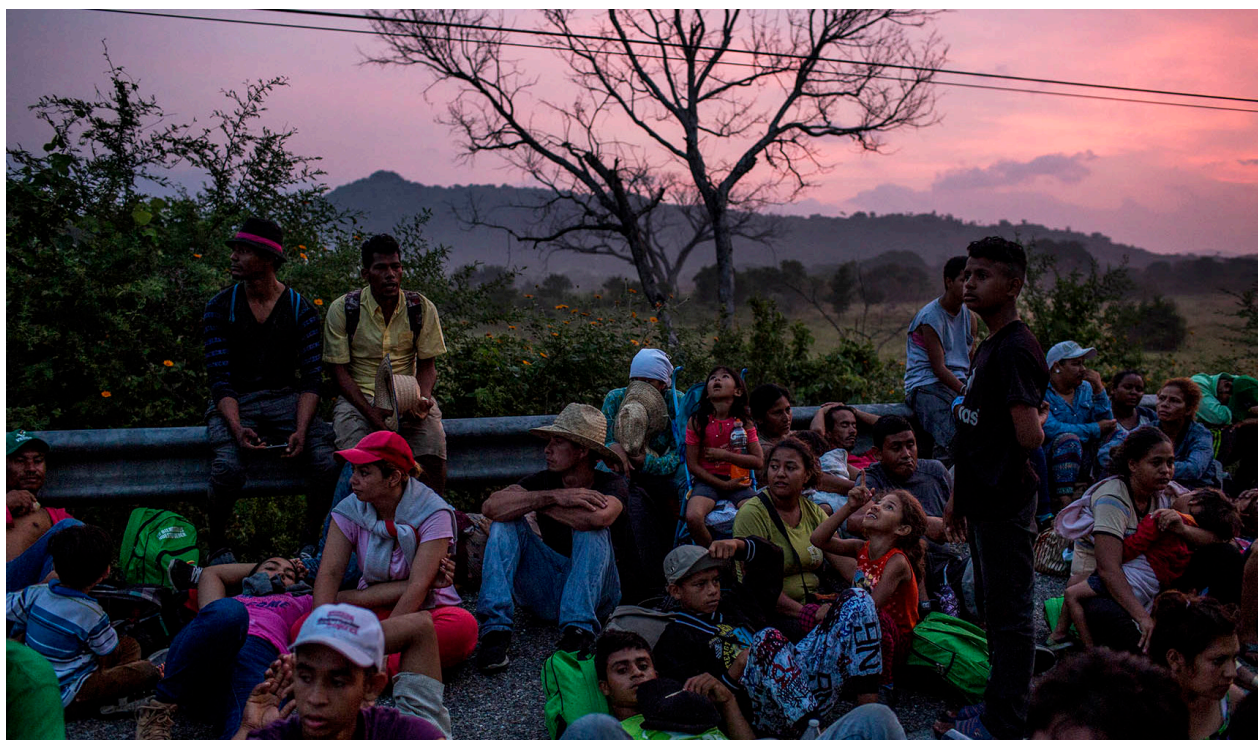
En la madrugada, la caravana se detiene en proximidad de la frontera que separa el estado de Chiapas con Oaxaca, por el bloqueo impuesto por la policía federal.