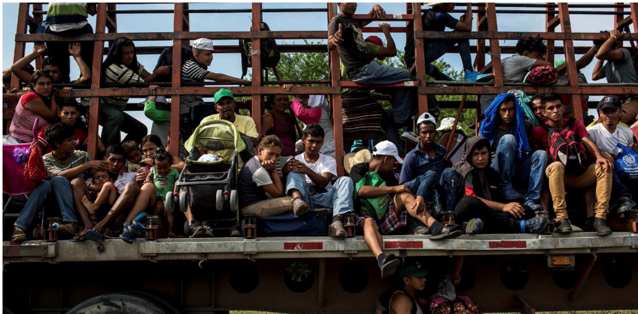
Familias enteras y hombres, en su mayoría, se amontonan encima de un tráiler

Nuevamente, a pesar de todas las dificultades, la necesidad de mantener vivo el sueño permitió a los migrantes superar cualquier dificultad, recorriendo rápidamente distancias inimaginables al principio de la caravana.