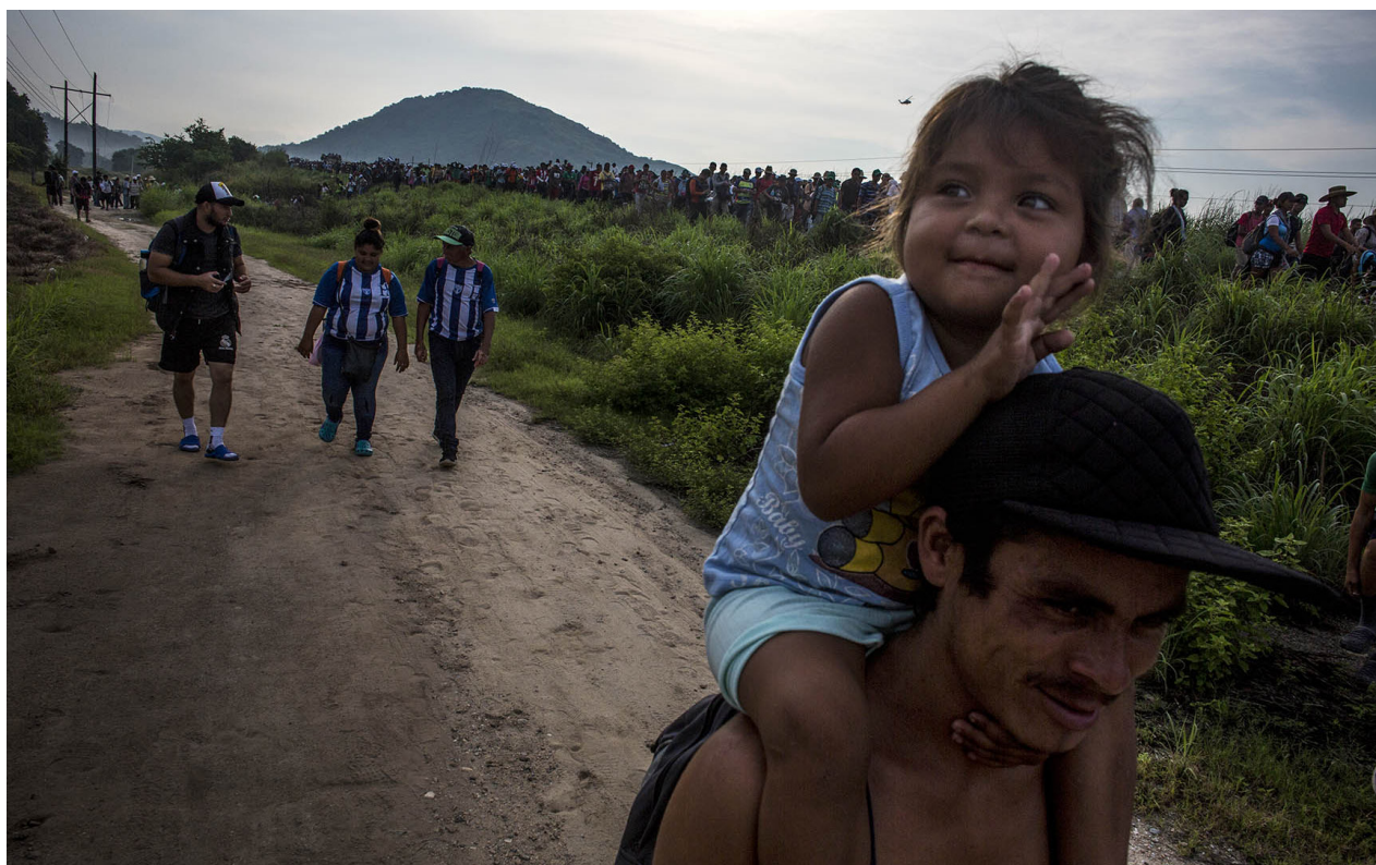
El flujo multitudinario de la caravana procede firme hasta San Pedro Tapanatepec