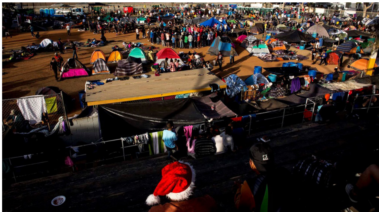
Vista del albergue de Tijuana, desde las gradas del campo de béisbol, en la tarde del 21 de diciembre

El diluvio del jueves 29 de noviembre inundó el campamento de Tijuana, destruyendo el último bastión de la caravana, aquel refugio que, en el transcurso de las semanas, se había llenado de miles de migrantes, niños, jóvenes, adultos y ancianos. Miles de migrantes que pasaban las noches amontonados en pequeñas carpas y los días engañando el tiempo, el hambre y la desesperación.