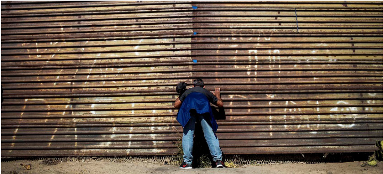
Un migrante observa el desplazamiento de militares estadounidenses del otro lado del muro fronterizo

La caravana se encuentra ya con una certeza: cruzar la frontera de Estados Unidos no es tarea fácil. Decenas de personas tratan de llegar al otro lado. Se topan con el muro y los gases y proyectiles lanzados por agentes norteamericanos. Punto de inflexión para el éxodo centroamericano. Tras la jornada del caos todo puede ponerse complicado.