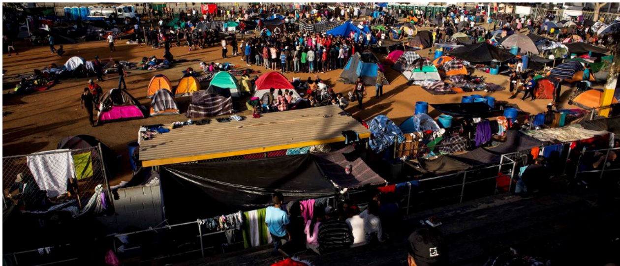
Vista del albergue de Tijuana, desde las gradas del campo de béisbol, en la tarde del 21 de noviembre

El campo de béisbol Benito Juárez fue el último de los recintos que enmarcaron el sueño colectivo: tal como había pasado en todas las paradas anteriores de la caravana, este diamante fue el campo de concentración para un pequeño pueblo nómada, un microcosmo representativo de buena parte de las desgracias centroamericanas: hondureñas, salvadoreñas, guatemaltecas, nicaragüenses.