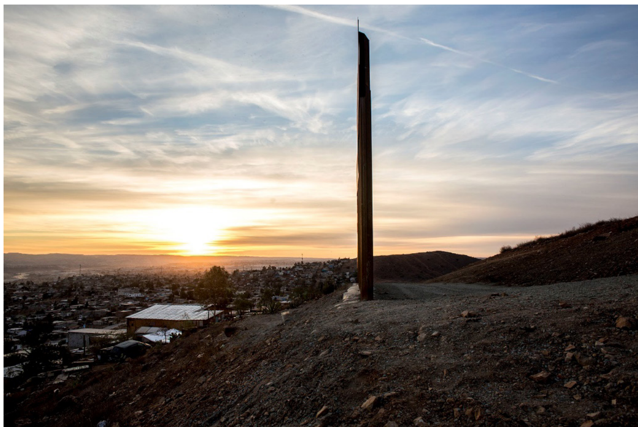
En el área denominada “Nido de las Águilas”, en Tijuana, el muro fronterizo termina, dejando libre la vista sobre los dos escenarios poblacionales opuestos, entre México y Estados Unidos

El campo de béisbol Benito Juárez fue el último de los recintos que enmarcaron el sueño colectivo: tal como había pasado en todas las paradas anteriores de la caravana, este diamante fue el campo de concentración para un pequeño pueblo nómada, un microcosmo representativo de buena parte de las desgracias centroamericanas: hondureñas, salvadoreñas, guatemaltecas, nicaragüenses. Tal vez, el aguacero del jueves sólo adelantó un final ya escrito, a pesar de que cientos de personas se resistieron en dejar el lugar.