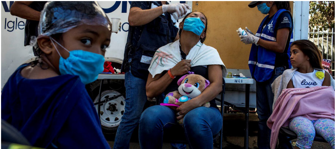
Madre e hijas se despiojan en una carpa montada fuera del albergue, gracias al apoyo de voluntarios de la Iglesia del Nazareno, el lunes 26 de noviembre

Gracias al apoyo de instituciones y grupos de voluntarios, la gran mayoría de migrantes logró conseguir la meta de alcanzar la frontera gringa. Sin embargo, las condiciones extremas del recorrido generaron cansancio y enfermedades.