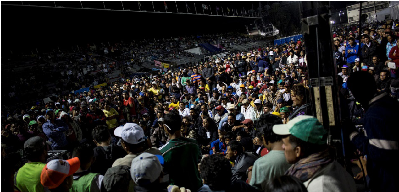
La asamblea colectiva en el estadio Martínez "Palillo", en Ciudad de México

Momento de "impasse" para el éxodo centroamericano. El estadio Jesús Martínez Palillo se convierte en campo de refugiados en la Ciudad de México. Aquí se informa sobre las opciones que tienen por delante. La gran mayoría quiere seguir hacia Estados Unidos y no hay relato terrible que les haga desistir.