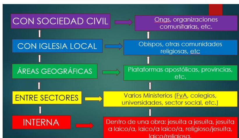
Gráfica 3 Los niveles de colaboración en la Compañía de Jesús. Tomada de la presentación de Claudio Solís, CPAL. “La colaboración en el corazón de la misión”, Asamblea SURAM, noviembre 11 de 2021.

Por otra parte, el llamado a esforzarnos en una mayor colaboración reitera los diferentes niveles en los cuales se expresa: