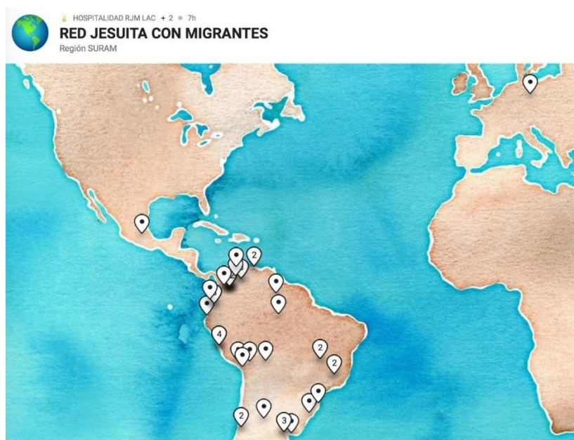
Gráfica 1: Localización geográfica de las personas participantes en la Asamblea SURAM 2021 (Actividad facilitada por Natalia Salazar, RJM LAC y el SJM Perú)