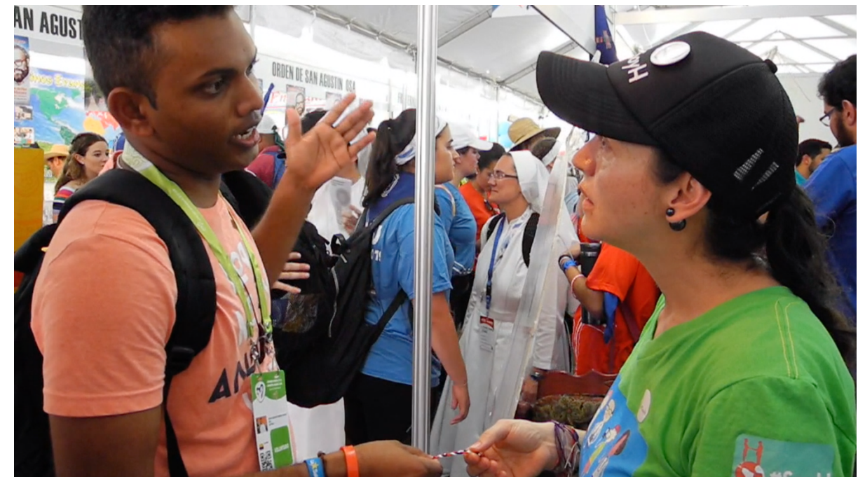
Hospitalidad en JMJ Panamá 2019

En el mes de enero se participó de la Jornada Mundial de la Juventud en la Ciudad de Panamá, donde más de 700 mil jóvenes católicos se congregaron para compartir con el Papa Francisco y renovar su fe proyectada hacia las acciones que los convocan en sus distintos países. En este evento la Campaña promocionó los contenidos de Hospitalidad y se produjeron algunos videos de la experiencia. Cerca de 2000 jóvenes interactuaron con distintas propuestas que realizó el equipo de la Campaña.